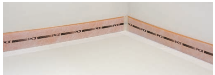
Abb. 7 – Der Einbau von PCI Pecitape® Silent als Randdämmstreifen ist dabei unerlässlich.