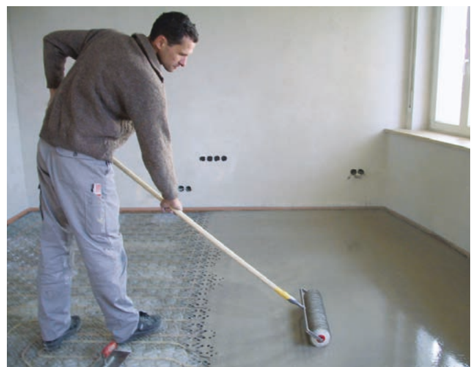
Abb. 8 – Die Überarbeitung mit der Stachelwalze regt den Verlauf an, dass die Spachtelmasse auch unter die Verlegematten gelangt.