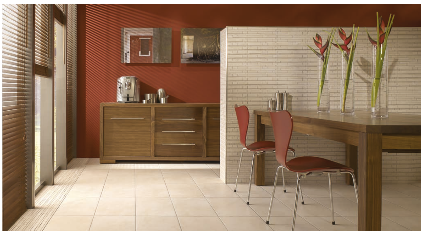
Behagliche Wärme erzielt durch eine Dünnschicht-Fußbodenheizung.