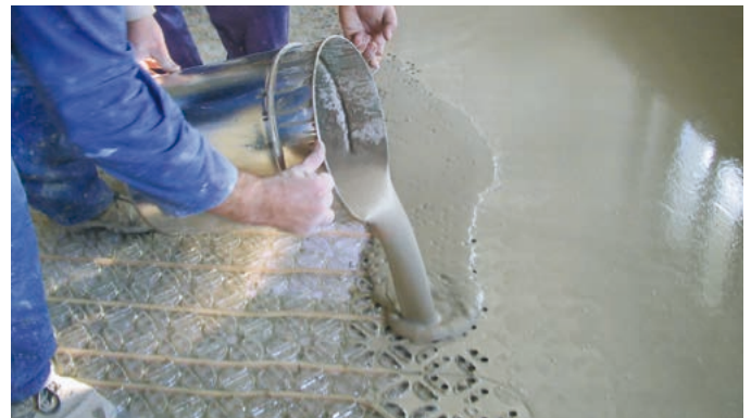
Abb. 6 – ...werden die Heizschläuche eingedrückt und mit PCI Periplan® Extra eingegossen.