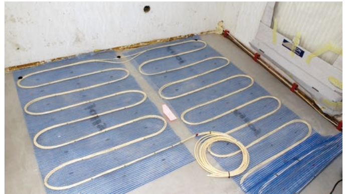
Abb. 9 – Die Heizung wird zunächst lose auf dem grundierten Untergrund ausgelegt.