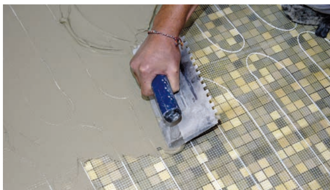
Abb. 2 – Mit Fliesenkleber erfolgt die Fixierung gegen Aufschwimmen.