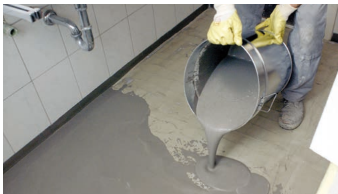
Abb. 3 – Nach der Erhärtung des Fliesenklebers wird die Fläche mit PCI Periplan® Extra egalisiert...