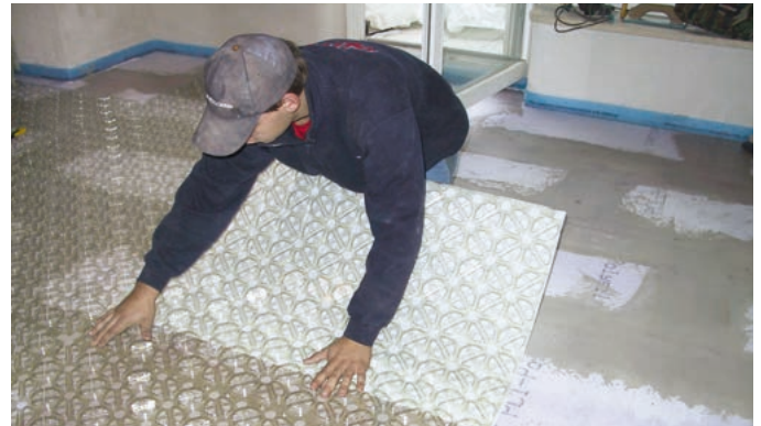
Abb. 5 – Nach der sorgfältigen Positionierung der Verlegematten auf dem grundierten Untergrund...