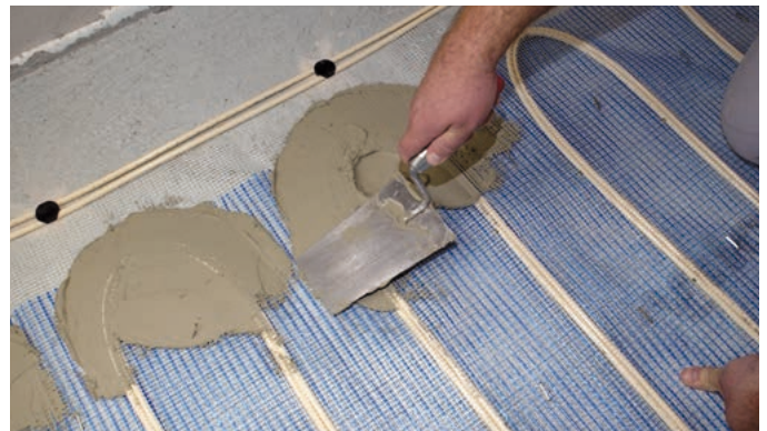
Abb. 10 – Anschließend werden die Enden der Heizung mit Fliesenkleber fixiert.