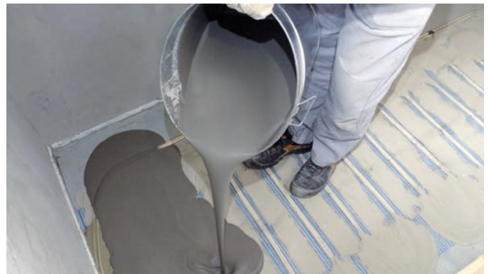
Abb. 11 – Das Vergießen der Heizelemente mit PCI Periplan® Extra sorgt für eine ebene Verlegefläche, hervorragende Heizwirkung und einen schnellen Baufortschritt.