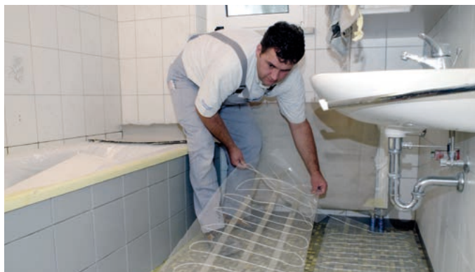
Abb. 1 – Die elektrischen Heizschlangen auf Trägernetz werden auf dem grundierten Untergrund ausgelegt.