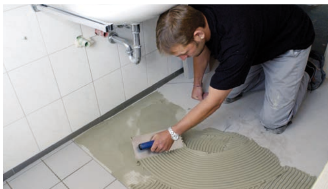
Abb. 4 – ...und der Plattenbelag mit PCI Nanolight® verlegt.

Nicht nur wenn der Bauherr die Immobilie selbst nutzt ist der Einbau einer Fußbodenheizung wirtschaftlich sinnvoll, sondern auch bei geplanter Vermietung der Immobilie – eine Fußbodenheizung steigert die Exklusivität des Objektes. Schon die alten Römer wussten um die Vorteile der Fußbodenheizungen und hatten entsprechende Systeme auf Heißluftbasis entwickelt.