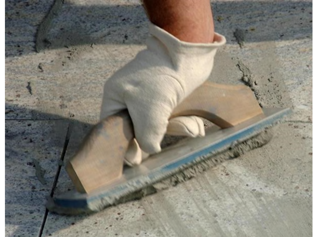
Harte Gummifugscheibe für hohen Füllgrad