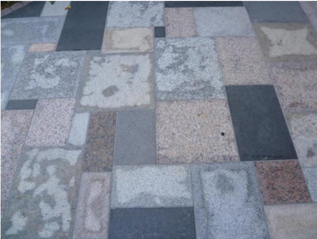
Saugfähigkeit als Kriterium zur Beachtung