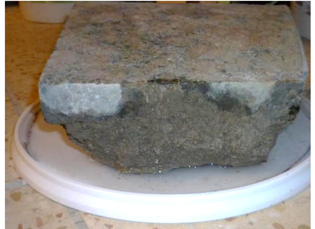
Rückdurchfeuchtung über die Fuge möglich