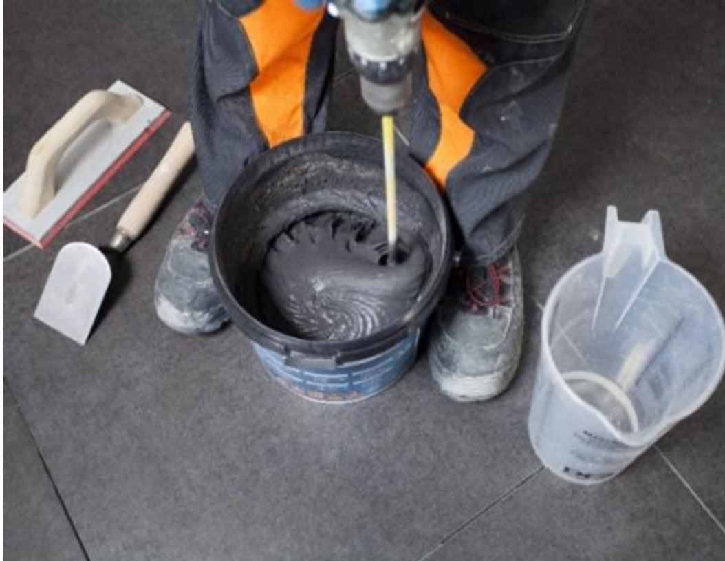
Werkzeug zum Verfugen