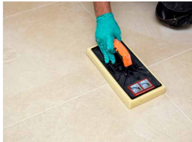
Für Fugen mit hohem optischem Anspruch.