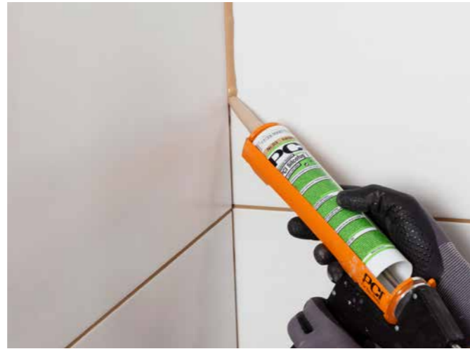
PCI Silcofug® E ist beständig gegenüber handelsüblichen Haushaltsreinigern und Desinfektionsmitteln; die geschlossene Fuge kann problemlos gereinigt werden.

Der elastische Dichtstoff schließt Eck-, Bewegungs- und Anschlussfugen im Sanitärbereich, in Schwimmbädern inkl. Becken und Beckenumgang sowie auf Balkonen und Terrassen. Anwendbar bei Glas, Aluminium, Holz, Emaille, Keramik, Hart-PVC und Sanitär-Acryl.