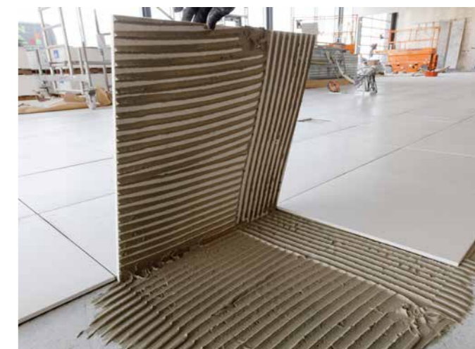
Ideal zum Verlegen von großformatigen Bodenfliesen.