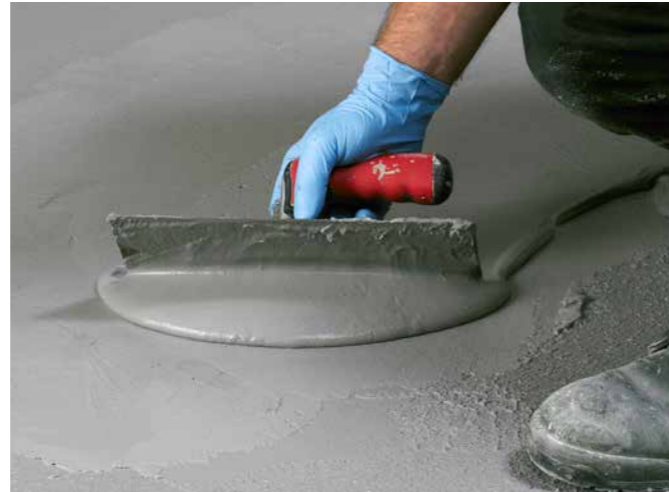
PCI Seccoral® 1K bietet mit der extrem cremigen Konsistenz für höchsten Verarbeitungskomfort eine neue Premiumqualität – bei gleichzeitiger Zeitersparnis.