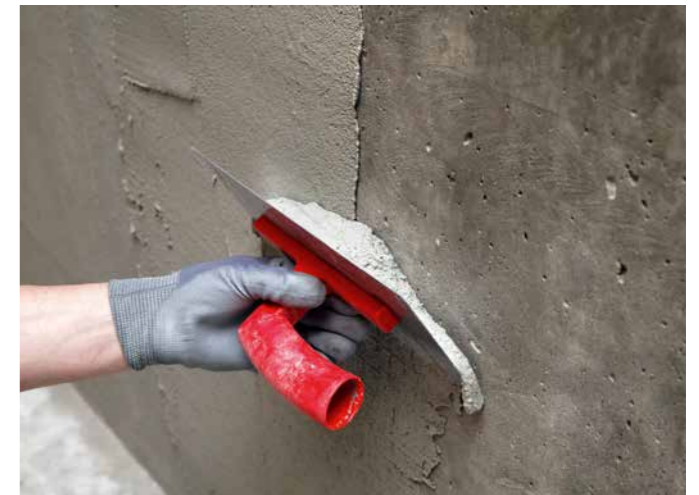
PCI Pericret® lässt sich sehr geschmeidig verarbeiten.