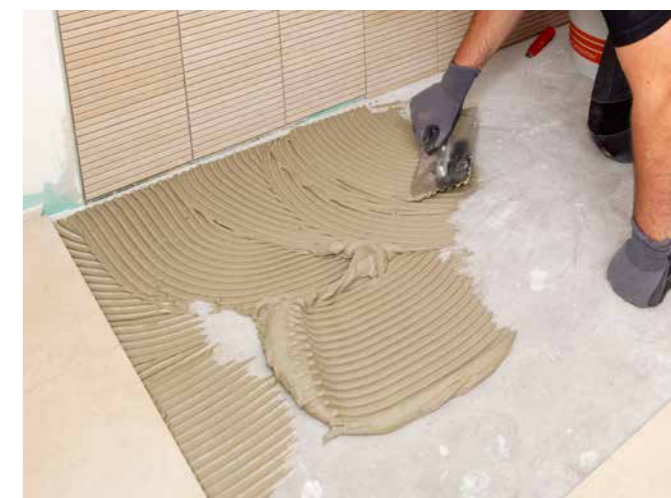
Variables Leistungsspektrum – für alle Untergründe und alle keramischen Beläge.