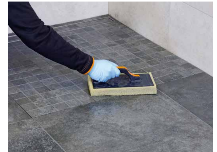
Speziell für die Verfugung von optisch hochwertigen Oberflächen wie z. B. Fliesen, Mosaik usw.