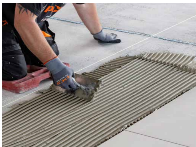
Für die Belegung von Zementestrichen/zementäre Heizestriche älter > 3 Tage (sobald begehbar).