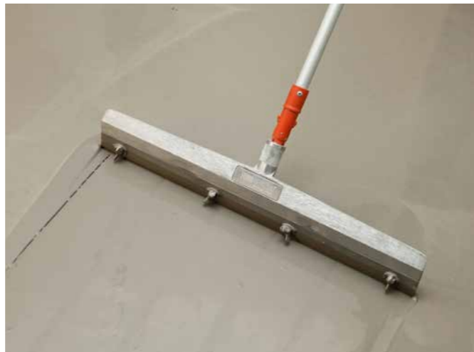
Rationeller und wirtschaftlicher Bodenausgleich mit PCI Periplan® vor dem Verlegen von Oberbelägen.