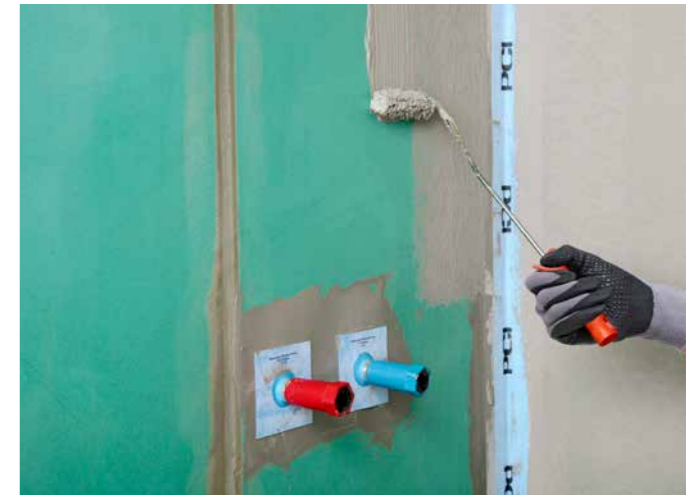
PCI Lastogum® wird unverdünnt durch Rollen, Streichen oder Spachteln auf den Untergrund aufgebracht.