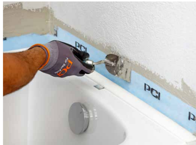
PCI Pecitape® WDB – einziges Wannendichtband mit allgemeinem bauaufsichtlichen Prüfzeugnis.