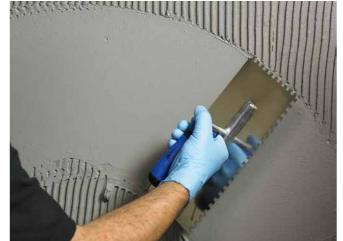
Die Sicherheitsdichtschlämme erfüllt die neue Abdichtungsnorm.